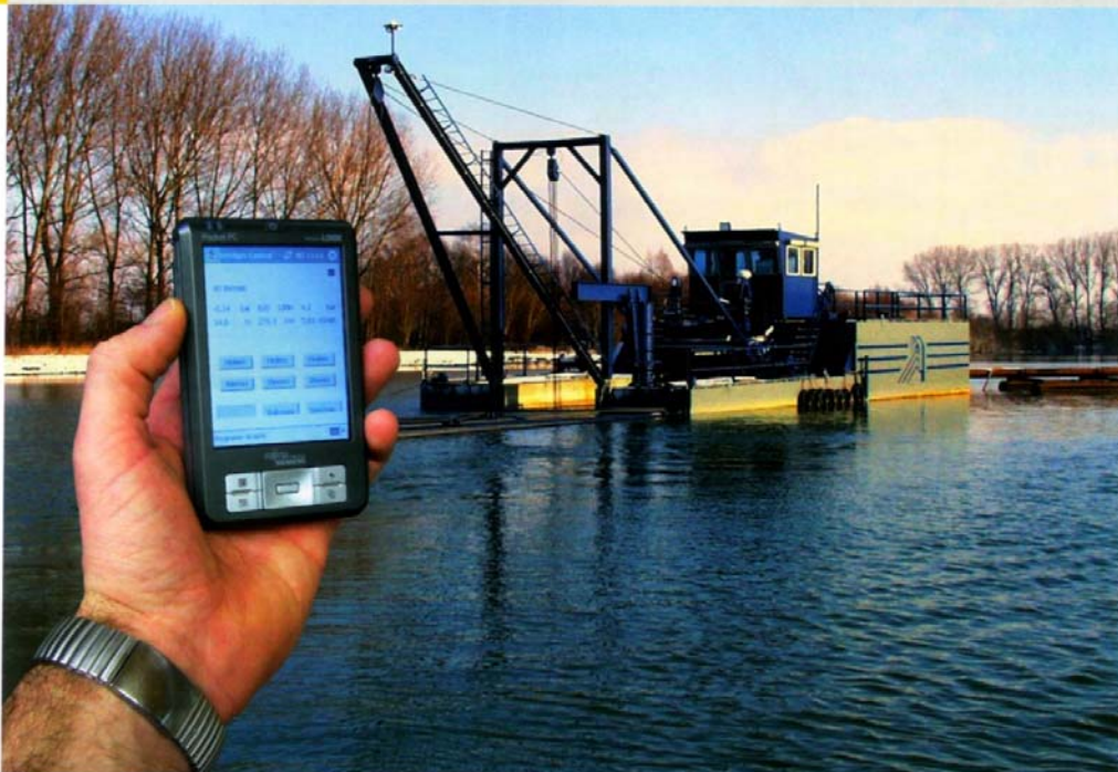
Das Saugschiff „Werthersechte“ lässt sich mit einem Handterminal fernsteuern.

Wirtschaftlichkeit, Optimierung des Energieverbrauchs und geringerer Verschleiß waren die Ziele der Modernisierung der Automatisierungstechnik des Saugbaggers „Werthersechte“. Mit dem Steuerungssystem DredgerControl der Team GmbH, basierend auf Beckhoff Busklemmen und TwinCAT, wurde der mannlose Automatikbetrieb des Saugbaggers realisiert. Das Monitoringsystem ermöglicht die Visualisierung und Steuerung jedes Aggregats auf dem Saugschiff, sowohl vom Bagger als auch von Land aus.