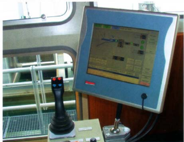
Jedes Aggregat auf dem Saugschiff kann gezielt über die Visualisierung auf dem Bagger oder von Land aus gesteuert werden.

Der Arbeitsstrom der Winden wird mit den 3-Phasen-Leistungsklemmen KL3403 überwacht. Über Richtungstasten können alle vier Winden gleichzeitig betätigt werden. Steigt der Windenstrom an einer oder mehreren Winden über einen voreingestellten Wert an, wird die Funktion automatisch deaktiviert. Die in der PC-Steuerung integrierte Arbeitsstromüberwachung der Winden verhindert die Überlastung der Antriebe und das Auslösen der Motorschutzschalter. Durch diese Technik können „alte“ Winden mit Schneckengetriebe ohne Umbau benutzt werden.